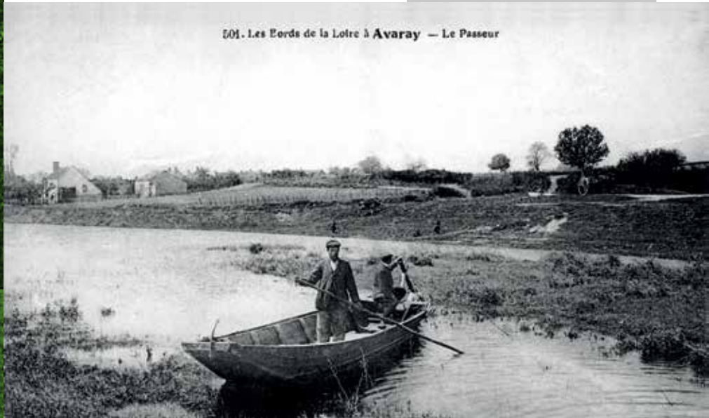
501. Les Eords de la Loire à Avaray — Le Passeur